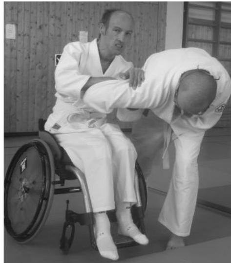
Ellenbogenstoß als Befreiung