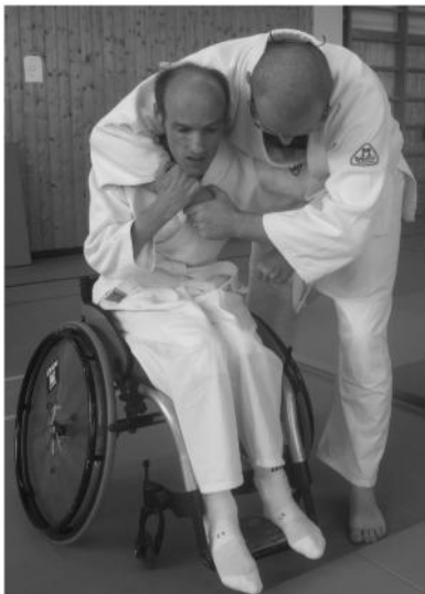
seitlicher Angriff / Armwürger -> Anwendung der Selbstverteidigung - Hebeltechnik